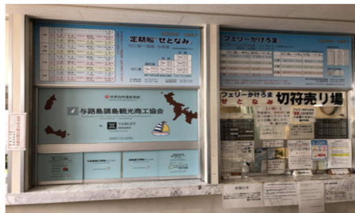
<古仁屋ポートコンシェルジュデスクの位置づけ>