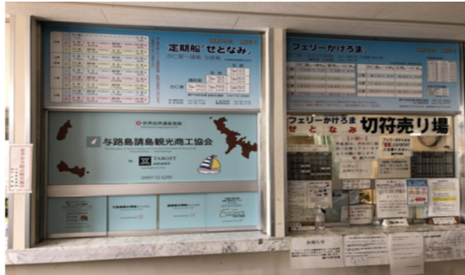
<古仁屋ポートコンシェルジュデスクの位置づけ>